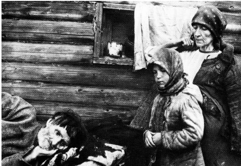
Luchd-tuatha Ruiseanach a' fannachadh leis an acras

6. Carson a tha Stòr F feumail mar fhianais mu chùisean san Ruis aig àm a' Chogaidh Chatharra?