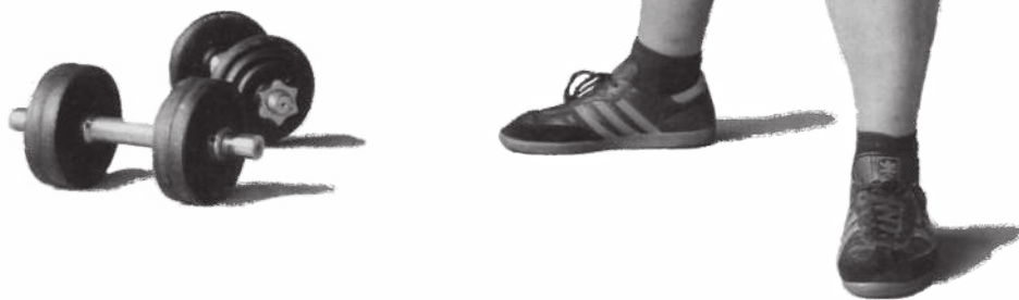
‘Schwitzen mit Rummelsnuff’ Sandra Piske, PRINZ Top Guide (Januar 2011)

25 Nach dem Training gehen wir in eines der vietnamesischen Restaurants im Center. Der Pumper isst eine doppelte Portion Ente und danach auch noch den Rest meiner Pho-Bo-Suppe, die ich nicht ganz schaffe. Ein paar zwielichtige Gestalten laufen an unserem Tisch vorbei. Ist mir egal. Rummelsnuff 30 sitzt ja neben mir.