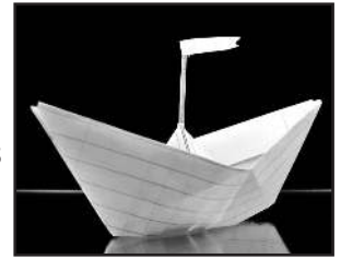
Paper boat

In Deutschland werden jährlich 200 Millionen Schulhefte verkauft. Nicht einmal zehn Prozent davon sind aus Recyclingpapier. Mitschuld tragen die verwirrenden Etiketten. So wird „holzfrei weißes Papier“ durchaus aus Holz(-fastern) hergestellt. Tipp: Auf das Zeichen „Blauer Engel“ achten. Dies garantiert, dass das Heft zu 100% aus Altpapier besteht.