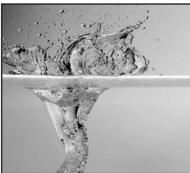
Water splash

Dass die Fahrt zur Schule mit dem Fahrrad gesünder und umweltschonender ist als im Auto, weiß jedes Kind. Trotzdem geben nur wenige Schulen Anreize, dauerhaft auf den Drahtesel umzusteigen: zum Beispiel mit einem schön gestalteten und einbruchssicheren Fahrradkeller oder einer betreuten Werkstatt auf dem Schulgelände.