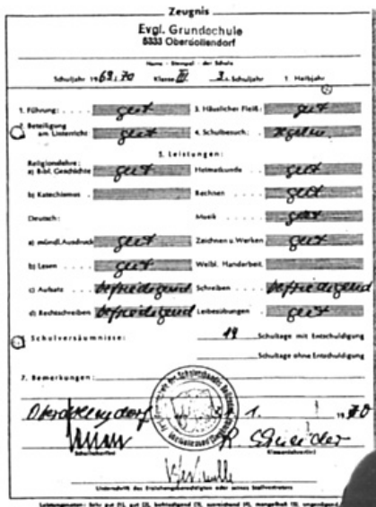
GUIDO WESTERWELLES Zeugnis der 3. Klasse